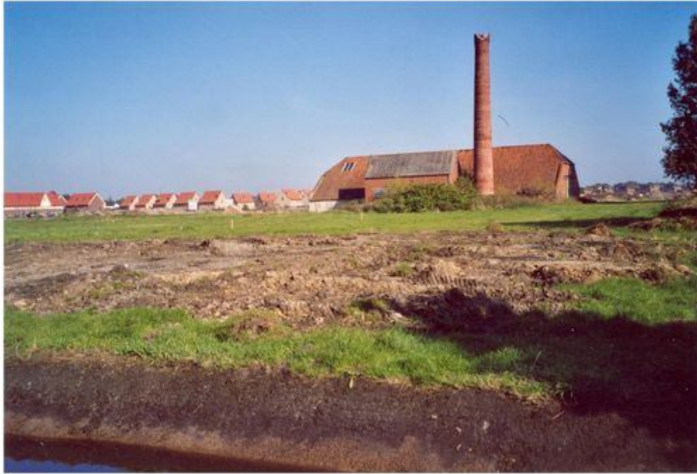
Tekst : Wim A.H. Rozema.