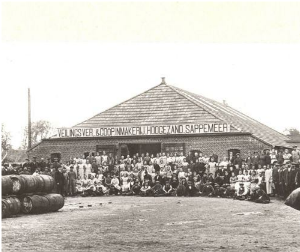
Het is alleen via voorinschrijving te verkrijgen, bij onderstaande adressen.