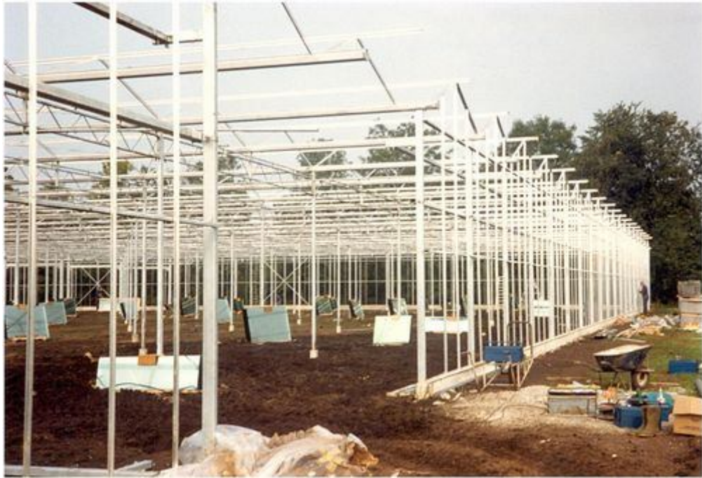
Een boekwerk met veel foto's over de tuinders en geschreven door de tuinders. De prijs van het boek bedraagt : €20,==