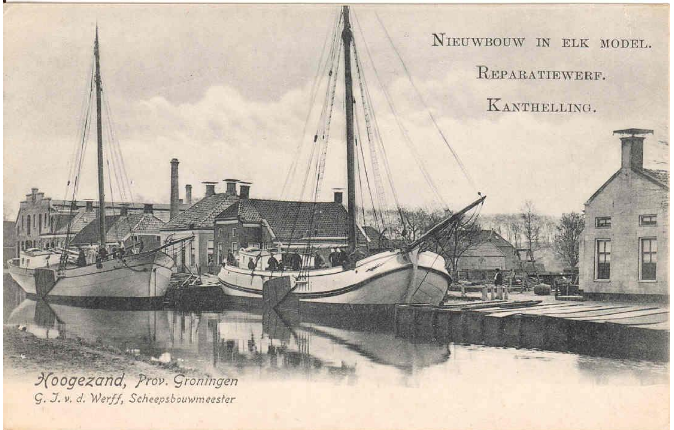
De werf in 1904.

In 1938 verhuisde de werf van Van der Werff naar Westerbroek, daar werd de produktie van grotere schepen ter hand genomen. In de zomer van 1962 werd besloten, om het nog in opdracht zijnde werk (de 4 baggerbakken) af te maken en vervolgens het bedrijf te beëindigen. Het personeel (toen nog zo'n kleine 40 man) had dan ruim de gelegenheid om naar ander werk uit te kijken. Rond de jaarwisseling 1962-1963 werd de grond verkocht aan de AKU (Akzo-Nobel) t.b.v. Silenka (PPG).