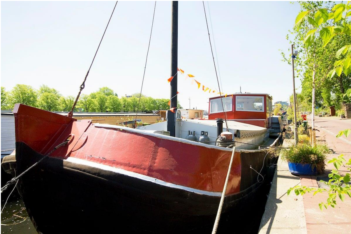
De Anna Sjoerdina anno 2021