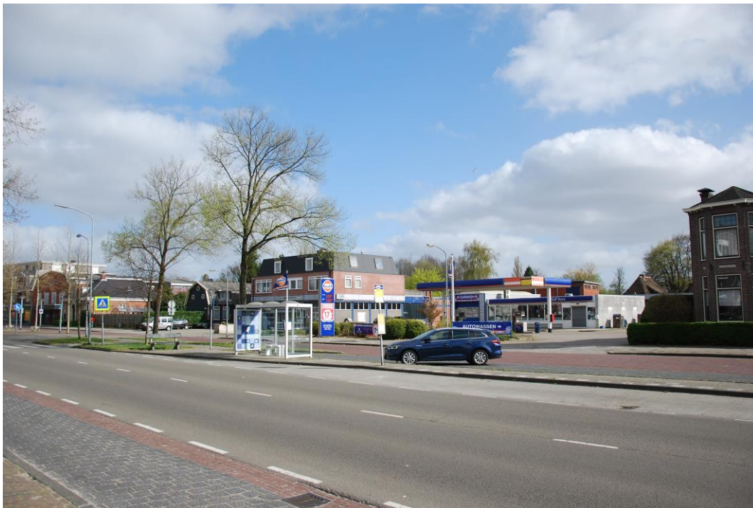
De huidige situatie.

Kijken we vanuit de westkant dan zien we op de foto uit 1926 de tewaterlating van het schip Kwiek in het oude Winschoterdiep bij scheepswerf Van der Werff aan de Zuiderstraat, later Hoofdstraat.