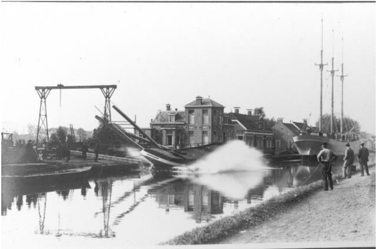
Scheepswerf Van der Werf in 1922.

Op de plek waar nu de garage met tankstation is, was tot 1938 de scheepswerf van de firma Van der Werff. Op de foto uit 1922, geschoten door de bekende fotograaf Harmannus Johannes Jozefus Conens, zien we de tewaterlating (stapelloop) van een schip bij deze scheepswerf. Op de werf een portaalkraan en rechts daarvan de directeurswoning.