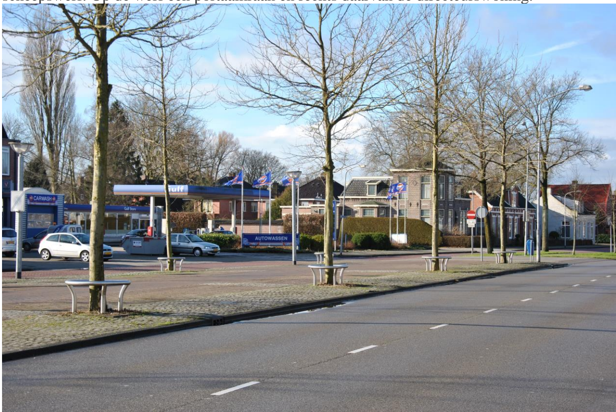
De huidige situatie.

Op de plek waar nu de garage met tankstation is, was tot 1938 de scheepswerf van de firma Van der Werff. Op de foto uit 1922, geschoten door de bekende fotograaf Harmannus Johannes Jozefus Conens, zien we de tewaterlating (stapelloop) van een schip bij deze scheepswerf. Op de werf een portaalkraan en rechts daarvan de directeurswoning.