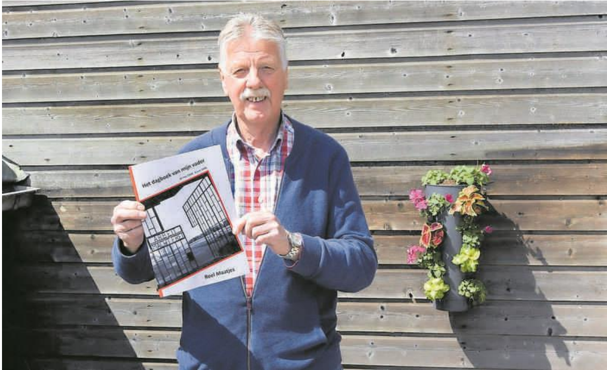
HS-krant, 10 juni 2020, pagina 9.